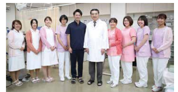
アットホームな院内で笑顔のスタッフが対応