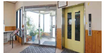
エレベーター完備で、車いすなどでも安心