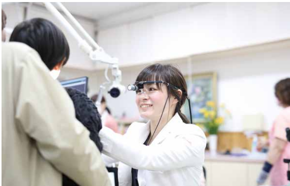
女性医師による診療も好評。小さなお子さんも安心して通える