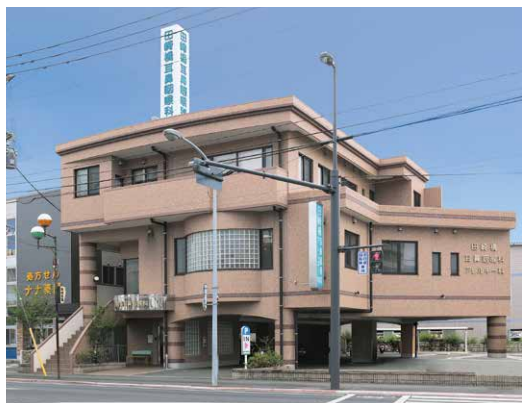
熊本市西区田崎の県道28号線沿い。ベージュの建物が目印